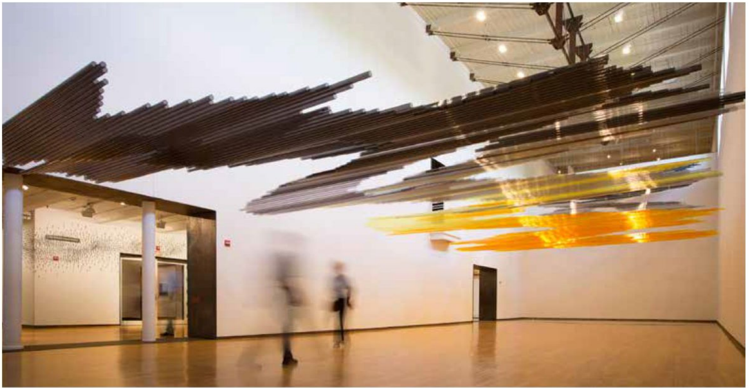
Black Sun , 2014. Polycarbonate tubes. Installation view. / Tubos de policarbonato. Vista de la instalación.